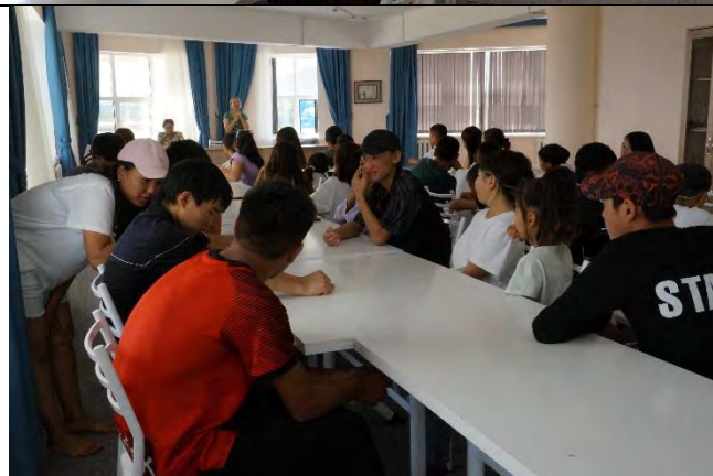
8) Детский лагерь «Улан» (Иссык-Кульская область, с. Тору-Айгыр): Количество детей: 120 (3 отряда)