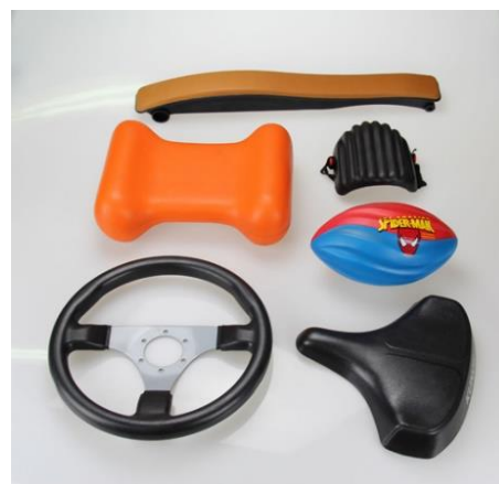
Продукция с пенополиуретановым покрытием

За исключением производства монтажной пены, во всех вышеуказанных сферах применения пеноматериалов используются готовые материалы, изготовленные на специализированных предприятиях. Монтажная пена производится по месту (т.е. с применением переносного оборудования по месту проведения изоляционных работ). Это важный аспект, поскольку он требует соблюдения мер безопасности, связанных с воспламеняющимися вспенивателями.