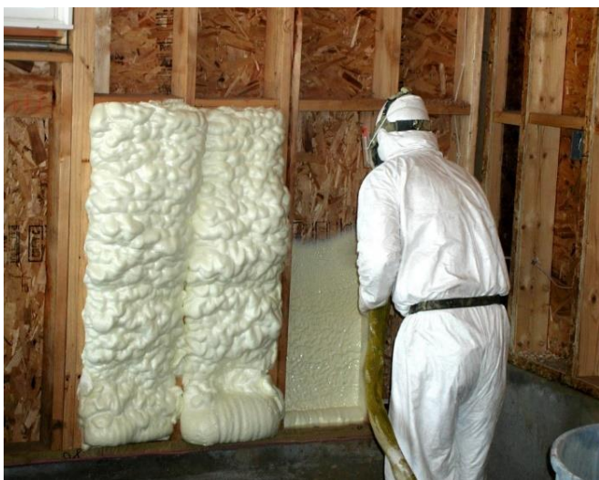
Использование монтажной пены