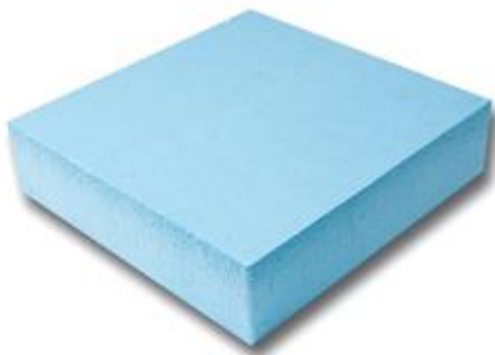
Панель из экструдированного пенополистирола